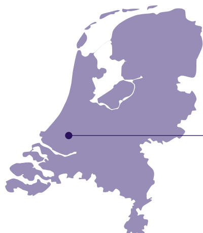
Emerald, wijk in Pijnacker-Nootdorp