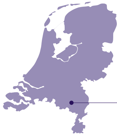
Budel en Maarheeze, gemeente Cranendonck